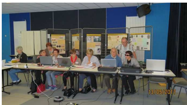
mai 2017